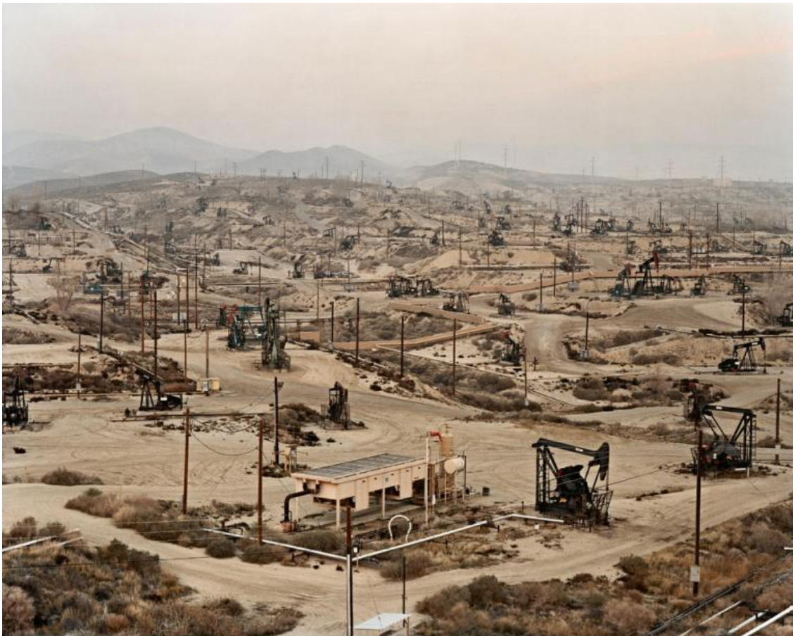
Edward Burtynsky .

La ragnatela delle persecuzioni antiebraiche nei due secoli che precedettero il ghetto veneziano, dalla Spagna e Portogallo alla Francia agli staterelli di ciò che restava del Sacro Romano Impero germanico, rende ancora più forte ed ‘eccentrica’ la scelta della Repubblica veneziana di ospitare, certo circoscrivendoli in uno spazio controllato, gli Ebrei in città. Già essi erano internamente articolati (italiani tedeschi levantini portoghesi) e parlavano lingue e praticavano riti diversi, come testimoniano le diverse sinagoghe (italiana, spagnola, levantina). Ma l’intera città era un mosaico di comunità straniere, ospitate e circoscritte: albanesi, greci ortodossi, turchi, arabi, persiani, tedeschi. Ne rintracciamo ancora i segni nel tessuto urbano. ‘Zone naturali’, simili a quelle che a Chicago saranno create nell’immigrazione del Novecento colorandosi di italiani, polacchi, irlandesi, ebrei (cui il sociologo Louis Wirth dedica nel 1928 “The Ghetto”, storia della comunità ebraica che nella metropoli si auto-seclude e quando la seconda generazione di immigrati cercherà di abbandonare quello spazio, fatalmente li riattrarrà ‘costringendoli’ a tornare volontariamente sui propri passi).